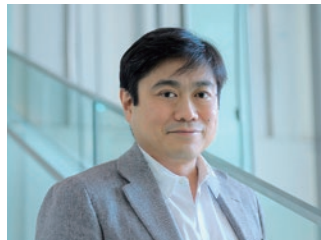
株式会社デジタルガレージ 共同創業者 取締役

DG Labの活動は、基礎研究から事業化のフェーズへと進んでいます。業界を代表するさまざまなパートナー企業を交えたオープンイノベーションを通じて、グローバルな視野で世の中の役に立つビジネスを生み出していきます。