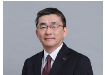
KDDI株式会社 代表取締役社長

技術の急速な進化によって消費者の生活スタイルも変化しています。DG Labの共同運営を通じて「価格.com」「食べログ」で新しい価値を生む機能の研究開発、さらには新たな事業の柱になる新規サービスを生み出していきます。