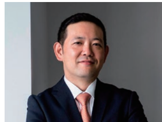
株式会社カカコム 代表取締役社長

技術進化がますます著しくなる今後は、研究開発の方針を素早く決める必要性が高まります。DGのようなサイズの会社がオープンプラットフォーム型の研究開発組織を運営しながらイノベーションを起こすことが必要になります。