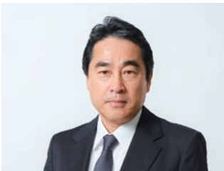
株式会社デジタルガレージ 代表取締役 兼 社長執行役員グループCEO 株式会社カカコム 取締役会長