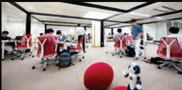
講義室 本プログラムでは、東3号館 総合研究棟の附属図書館にある先進的学習スペース AIA (Ambient Intelligence Agora) 内に、専用の講義スペースを設置します。

下記の講義室、ライブラリ、修了証授与の他、論文データベースへのアクセスなど様々な特典を提供します。