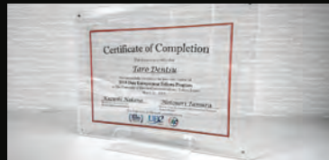
修了証 プログラムの修了要件を満たした受講生には、修了証を授与します。

最新情報、募集要項等は、 データアントレプレナーフェロープログラム公式ウェブサイトに掲載しています。