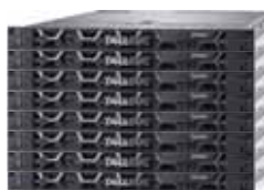
ワーカーサーバー AIモデルのコンパイルやCS-2の制御