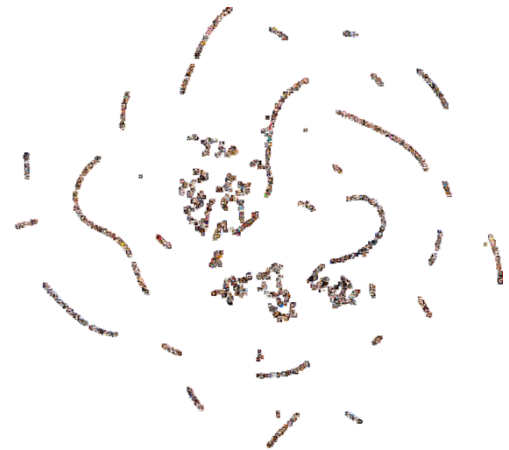
図 2 -SNE 法を用いた顔画像に限定した性別推定の可視化

の結果の一例を図 2 に示す. 人の純粋な顔の他に装飾品や車などの男女によって嗜好に差が出やすい情報を活用し, 推定が行なわれている可能性が示された. 年齢推定では, 人物画像に限った場合に転移学習を行うことで精度が改善されることが確認された. このことから, 性別を推定するために生成される特徴量と年齢推定のための特徴量生成方法は近い性質を持つ可能性があると考えられる. 性別推定と年齢推定では, 顔に限定したデータセットであっても従来の研究[8] よりも低い精度であったが, これはデータセットの性質によるもの大きいと考えられる. Facebook では本人を特定できる画像の使用が推奨されているものの, 他人の画像をプロフィール画像に設定している場合も少なくない. 実際に誤判定の中には子どもや芸能人の写真が多く含まれており, 明らかに異なる性別の被写体が使用されているものも複数存在していた. これらのケースでは正しく推定することが困難であるため, 本実験のような結果が得られたと考えられる. また, 年齢推定においてもユーザーによって年齢の登録が行われるため, 本当の年齢が登録されているかは定かではないほか, SNS のプロフィール画像は長期間同じものが使用されることが多いことや, 過去に撮影した写真を用いることも多いことから, 被写体が本人であったとしても現在の年齢を反映した写真を使用しているとは限らない. また, 女性ユーザーにはプリクラなど画像加工によって年齢が分かりにくくなっているケースも少なくない. そのため, 予測がうまく行えない場合が多くなったと考えられる.