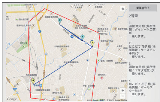
図 2: 車載アプリのスクリーンショット