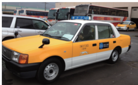
図 3: 実験車両の様子

テムのデザインと実装, 観光情報学会誌, Vol. 7, No. 1, pp. 1-9 (2011)