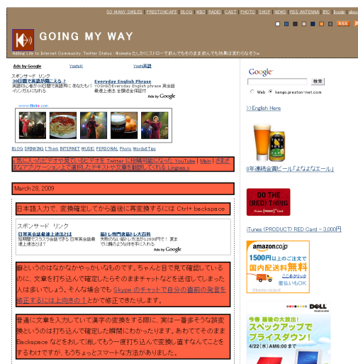
図 3: 実験結果の Web ページ例（コンテンツ抽出後）

実験結果を表 1「コンテンツ抽出性能」に示す（完全一致率は PM と表記）。実験結果より、提案手法は全体的に高い性能を示していることがわかる。一方、コンテンツを過不足無く認識できた Web ページは非常に少なかった。図 3 *15 はコンテンツ自動抽出を行った Web ページの例である（着色部分がコンテンツを示す）。上部のナビゲーション部分が誤認識されているが、概ねコンテンツが抽出できている。