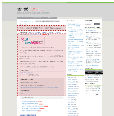
図 1: Web ページに占めるコンテンツの例 (破線部分)

*2 http://www.100shiki.com/archives/2009/04/lovelogger.html