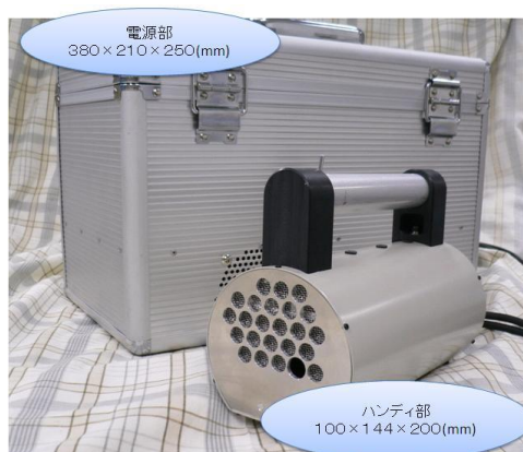
図 3: Big Fat Wand の筐体