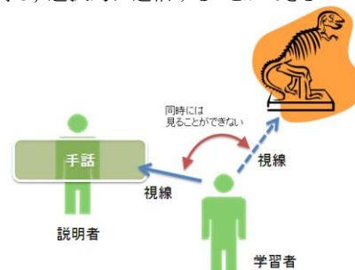
図 1: 聴覚障害者の学習の難しさ

パソコン側のソフトウェアにはコンテンツ作成用と送信用の 2 種類のソフトウェアがある。コンテンツ作成用のソフトウェアでは入力された図形の境界線を抽出し、ハードウェアに送信可能なデータに変換する。送信用のソフトウェアは作成されたコンテンツを登録し、選択的に送信することができる。