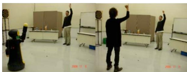
図 3 ロボット独自の指し示し方法 (左) とそれを模倣する被験者 (右)