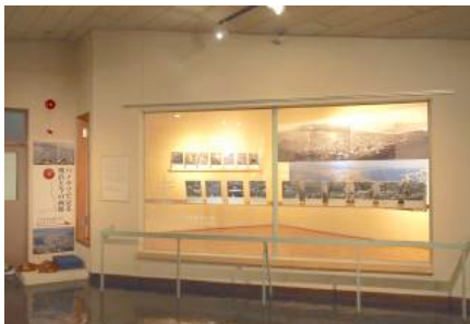
図 4 制作した展示空間

市立函館博物館情報ブース「未来」に、明治 25 年に撮影された函館のパノラマ写真を用いた展示空間を制作した(図 4)。情報ブース「未来」は、市立函館博物館と公立ほこだて未来大学の連携事業として 2014 年に開設された。同館の保科学芸員の発案で、来場者が展示ケース内に入るという新しい鑑賞体験の提供する展示空間として活用されている。この展示空間に調査から得た要素である、path や edge などの地理的情報を現在と結びつけ、適切な landmark を提示し鑑賞者の探索を促すためのプローブを 2 点取り入れた。制作した展示空間は「パノラマで見る明治と今の函館」と題し、2015 年 10 月 3 日より一般公開した。