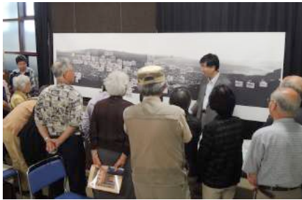
図 2 古写真講座の様子(市立函館博物館集會室)

2015 年 6 月 17 日に市立函館博物館で開催された「古写真・古地図を歩く」講座の観察を行った。参加者は 60 代女性 11 名、60 代男性 11 名であった。学芸員と説明役の 2 名は参加者に対し明治 25 年のパノラマ写真の解説を行った(図 2)。