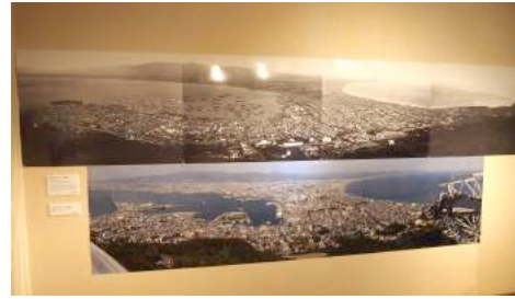
図 5 パノラマ写真の展示

明治 25 年のパノラマ写真は、平成 23 年に函館市中央図書館で発見されデジタルデータ化されたもので、明治 25 年に田本研造によって薬師山砲台跡からガラス乾板を用いて撮影されたとされている。現在の函館のパノラマ写真は平成 27 年に川嶋稔夫によって、デジタルスチールカメラを搭載した自動撮影雲台 GigaPan を使用して函館山ロープウェイ屋上展望台から撮影された。