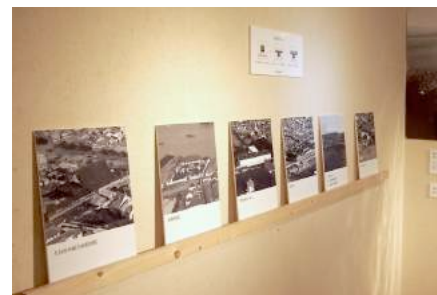
図 6 建物探索パネル

鑑賞者の探索行為を促すためのプローブとして、パノラマ写真の中から landmark となる建物を拡大した「建物探索パネル」を設置した(図 6)。現在のパノラマ写真から拡大したものを 8 枚、明治時代のパノラマ写真から拡大したものを 18 枚、計 26 枚制作し、その内 17 枚を設置できるようにした。鑑賞者がパネルを手に持ち、明治と現在のパノラマ写真の中から建物を探索するようキャプションで説明を加えた。建物探索パネルに使用した建物は著者が行った観察の中で landmark として活用できると判断したものである。